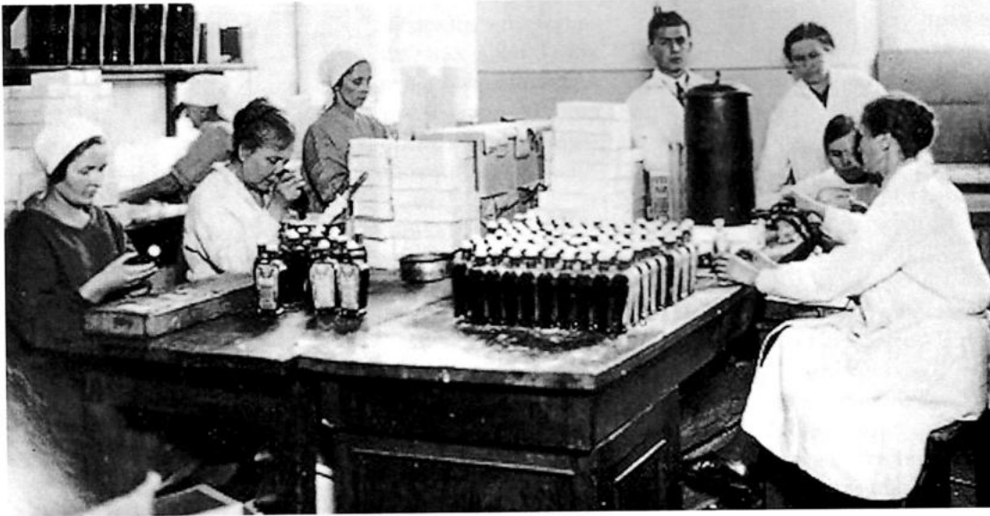
На виробництві органопрепаратів

дартизований інсулін у масовому масштабі, наприклад, з 1931 до 1940 р. його виробництво зросло у 18,5 разів, що дало змогу забезпечити інсуліном потреби не лише України та інших республік СРСР, але й експортувати його до ряду країн.