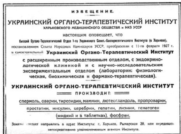
Рекламне повідомлення про реорганізацію Інституту